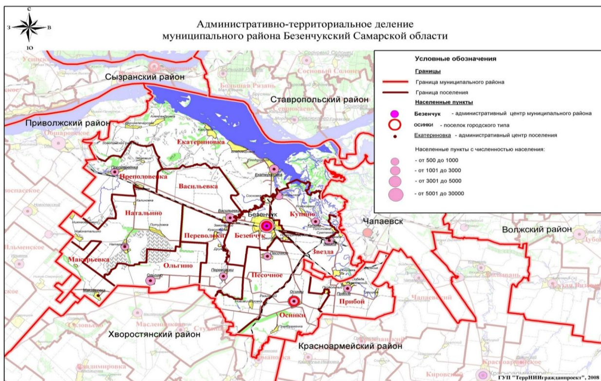
Рис.1 – Административно-территориальное деление муниципального района Безенчукский Самарской области

Административно-территориальное деление района представлено 12 поселениями, в состав которых входят 2 поселка городского типа и 49 сельских населенных пунктов (рис. 1).